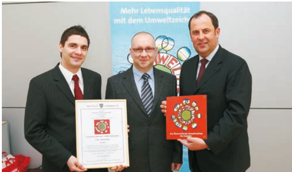
Umweltzeichen für das Druckhaus Schiner

Am 22. Februar erhielten die beiden Jung-Unternehmer aus den Händen von Umweltminister Josef Pröll das Österreichische Umweltzeichen des Lebensministeriums. Damit erhöht sich die Zahl der ausgezeichneten Wirtschaftsbetriebe auf insgesamt 88. Unter diesen gibt es übrigens nur 10 Druckereien. P&D gratuliert recht herzlich! KP